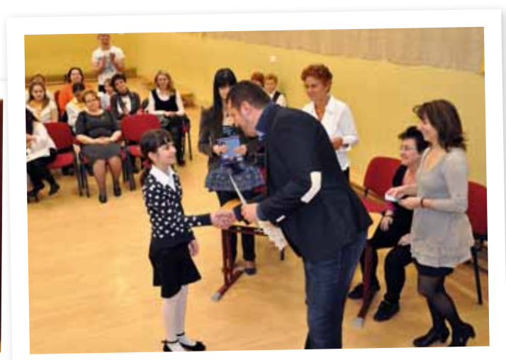
Erzsébetváros 2014. április 24.