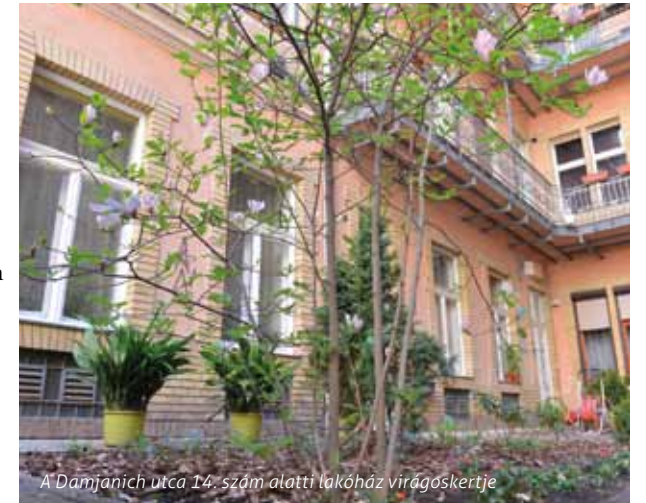
A Damjanich utca 14. szám alatti lakóház virágoskertje

Az Erzsébet Terv keretében a lakóházak növényesítése mellett számos