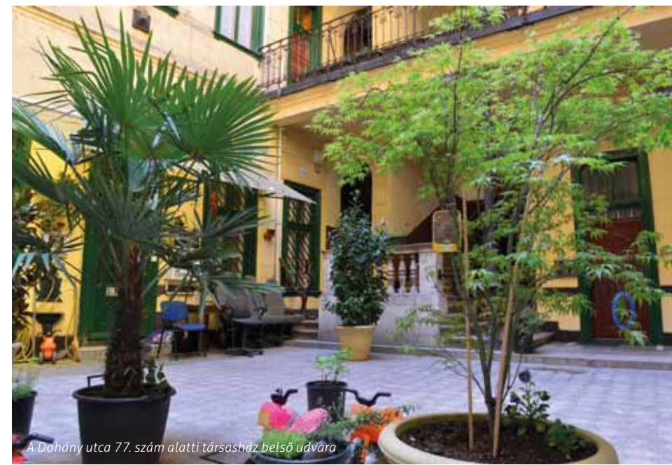
A Dohány utca 77. szám alatti társasház belső udvara

is. Erzsébetváros önkormányzata kiemelt figyelmet fordít a közterületek növényesítésére is, ennek eredményeként tavaly 60 planténert, 41360 virágot, 245 rózsát, 7856 cserjét és 115 fát ültetett Erzsébetvárosban. Idén tovább folytatódnak a zöldberuházások az Erzsébet Terv fejlesztési program keretében és a társasházak körében népszerű növényesítési pályázatot is újra kiírják az őszi folyamán.