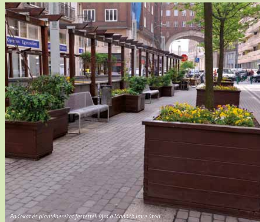
Padokat és planténereket festettek újra a Madách Imre úton