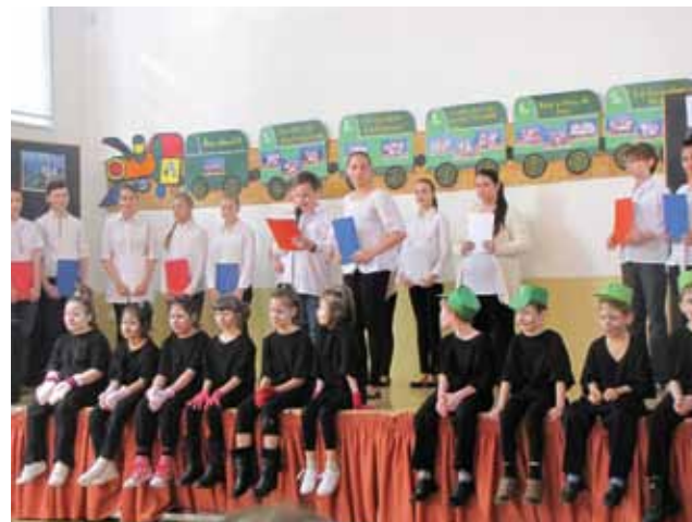
Erzsébetváros 2014. április 24.

ismertető műsor. A csehül és magyarul előadott énekkel már a tavaszt köszöntötték. Üde színfolt volt a kisdíjak tánca, akik között felbukkant a híres Kisvakond is. Ütemes taps kísérte a cseh népi táncot, ezzel zárult a délelőtt.