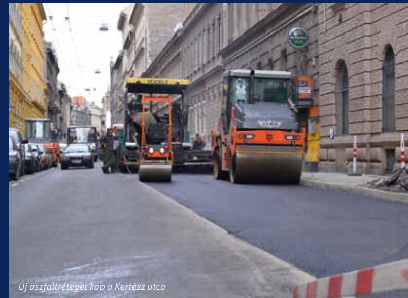
Új aszfaltréteget kap a Kertész utca

Az utca felújítását két ütemben végzik: a Dob utca–Wesselényi utca közötti szakasz már tavaly decemberben elkészült, míg a Wesselényi utca–Dohány utca közötti rész felújítása idén márciusban vette kezdetét. A kivitelező a régi, töredezett burkolat lemarását követően a teljes út- és járdaburkolatot kicseréli, az említett felületek új aszfaltréteget kapnak. A Hársfa és a Nagy Diófa utca rekonstrukciójához hasonlóan a Kertész utcában is speciális burkolati felület segíti majd a gyengéltételek közlekedését. Új utcabútorok és hulladékgyűjtők is helyet kapnak, továbbá növénydézsák telepítésével teszik zölddebbé a területet.