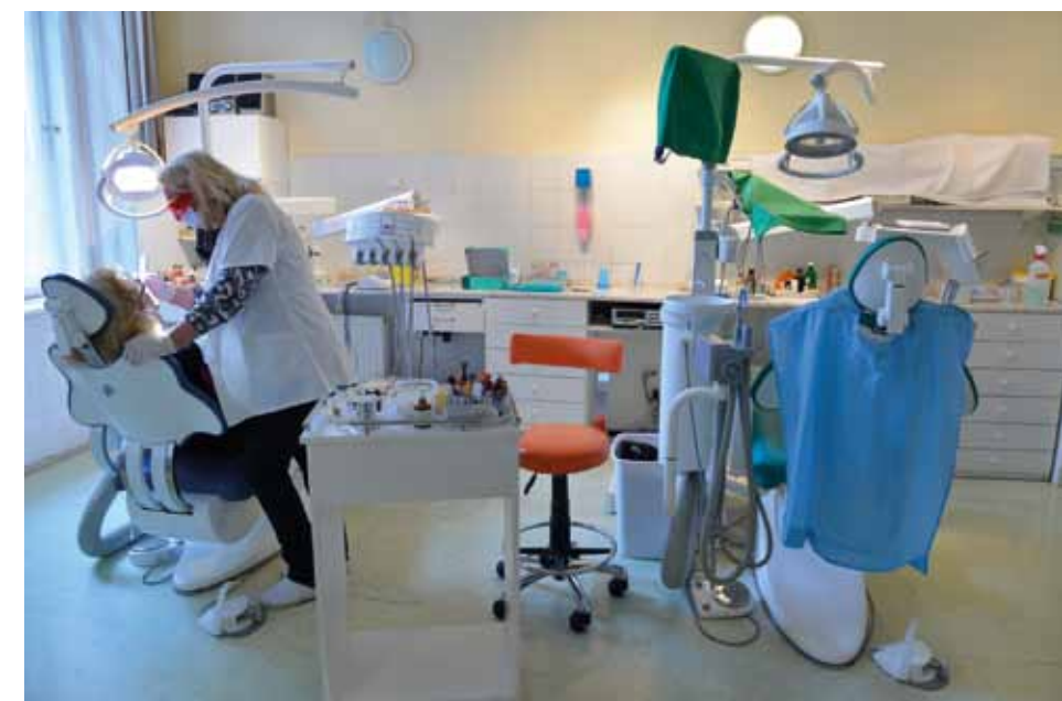
Erzsébetváros 2014. április 24.

1072 Bp., Csányi u. 3. fszt. 2.; Tel.: 322-3915